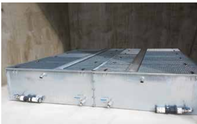
Retención total del dieléctrico