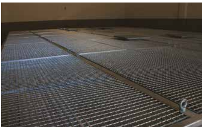
Cubierta con rejillas