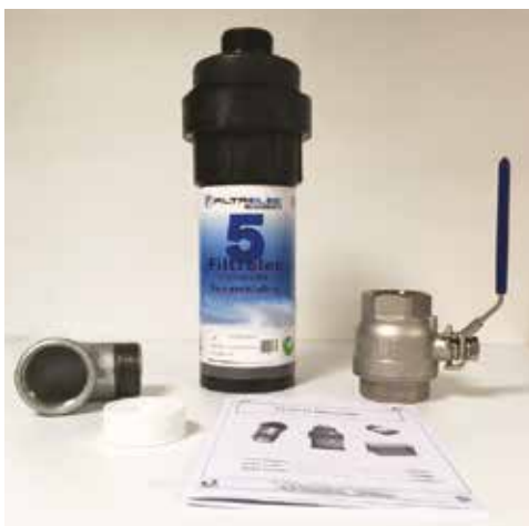
Caudal de 5 litros por minuto con flujo por gravedad

FILTRELEC® es una alternativa técnico-económica a decantadores y separadores aceite-agua tradicionales.