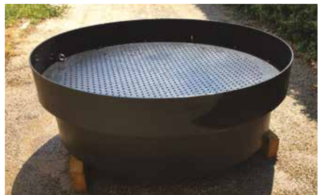
Caudal de 1500 litros por minuto con flujo por gravedad