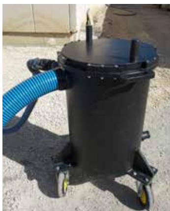
Caudal de 50 litros por minuto con bomba