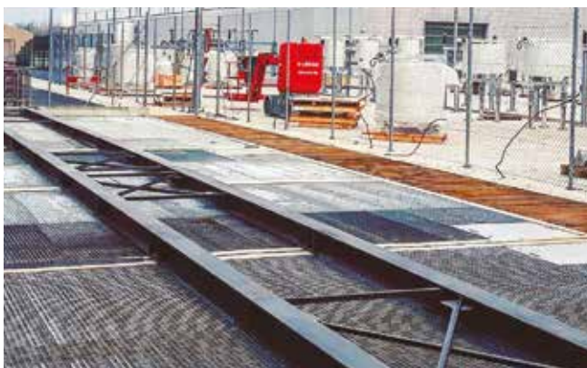
Vigas soporte transformador (si es necesario)