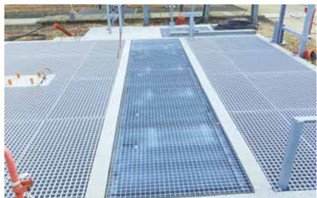
Rejilla de protección